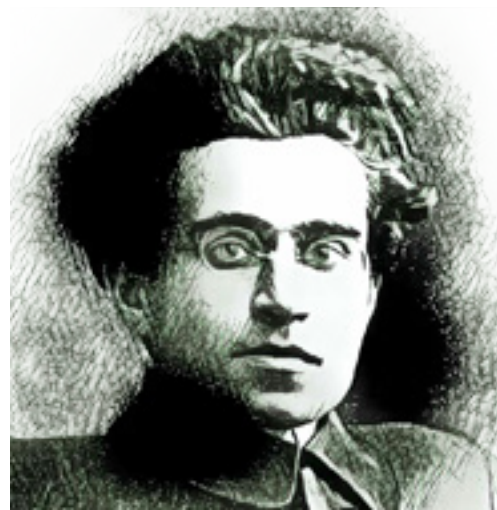
Antonio Gramsci (1891-1937)

Y quién sabe cuánto tiempo durará todavía ese contraste. Carducci se preguntaba: “¿Cuándo será alegre el trabajo? ¿Cuándo será seguro el amor?” Pero todavía estamos esperando una respuesta, y quién sabe quién sabrá darla. Muchos dicen que el hombre ha conquistado ya todo lo que debía conseguir en la libertad y en la civilización, y que ahora no le queda más que gozar el fruto de sus luchas. Yo creo, en cambio, que hay mucho más por hacer: los hombres están sólo barnizados de civilización y, en cuanto se les rasca, aparece inmediatamente la piel de lobo. Los instintos se han amansado, pero no se han destruido, y el único derecho reconocido es el del más fuerte. La revolución francesa ha abatido muchos privilegios, ha levantado a muchos oprimidos; pero no ha hecho más que sustituir una clase por otra en el dominio. Ha dejado, sin embargo, una gran enseñanza: que los privilegios y las diferencias sociales, puesto que son producto de la sociedad y no de la naturaleza, pueden sobrepasarse. La humanidad necesita otro baño de sangre para borrar muchas de esas injusticias: que los dominantes no se arrepientan entonces de haber dejado a las muchedumbres en un estado de ignorancia y salvajismo, como están ahora.