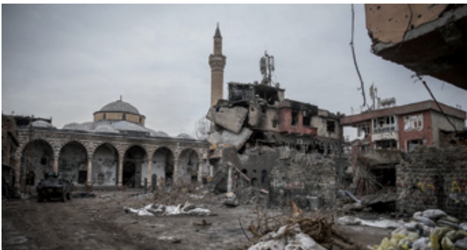
Bombardeos turcos en Kurdistan

Mientras la estrella de la izquierda se apagaba en Turquía por las encarcelaciones masivas, expulsiones, asesinatos y torturas, el PKK logró reforzarse gracias a las acciones militantes llevadas a cabo en las prisiones de los torturadores. En 1984, el PKK dio comienzo a la guerra de guerrillas en el país. Los años comprendidos entre 1984 y 1990 estuvieron marcados por los enfrentamientos militares, y en 1990 el Kurdistán protagonizó un levantamiento popular (serhildan) semejante a la Intifada palestina. En 1991, el partido kurdo entró en el Parlamento, en colabora-